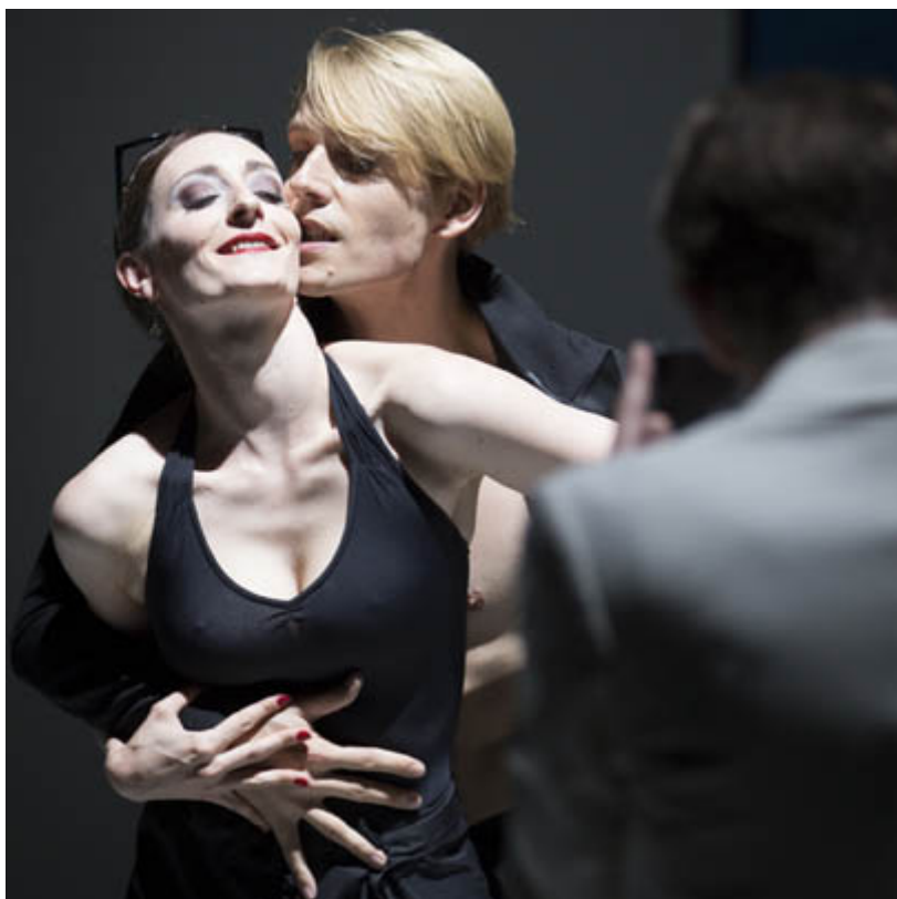
Smrt v Benetkah