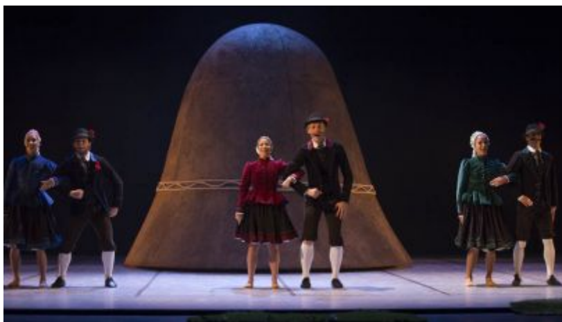
Kekec