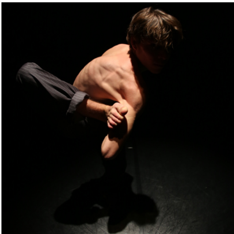
Alien Express

Alien Express; Flota, Ljubljana; koprodukcija: Plesni teater Ljubljana; avtorja in izvajalca: Žigan Krajnčan in Gašper Kunšek ; glasba: Kristjan Krajnčan ; mentorstvo: Kaja Lorenci; oblikovanje svetlobe in fotografije: Borut Bučinel. Na festivalu Bobri sta se pred mladim občinstvom izkazala, da nista le mojstra gibalnih vragolij, ampak prava ambasadorja plesa.