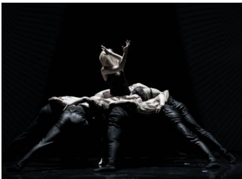
Moški z nožem