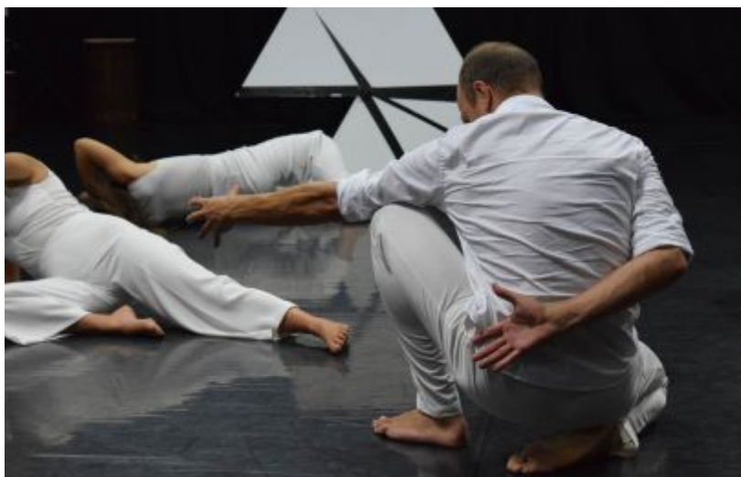
Niti strela ne udari v ravni črti