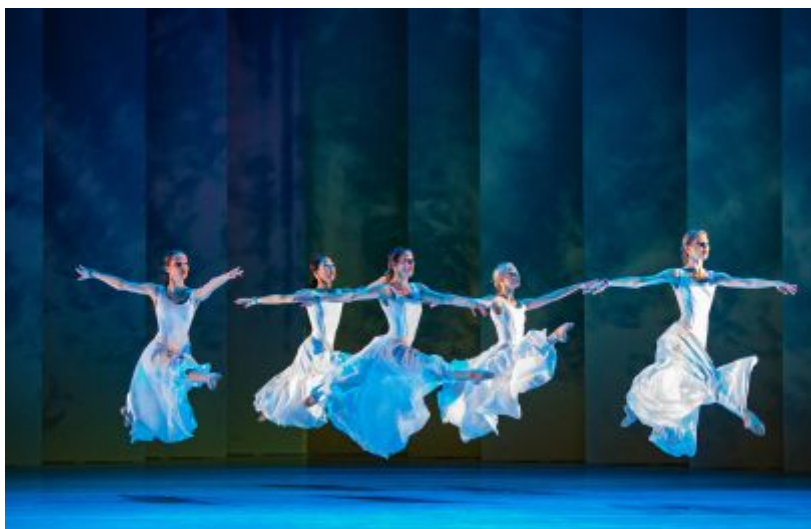
Pastoralna simfonija